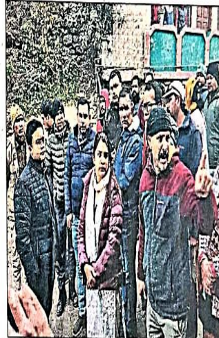
जोशीमठ में मंगलवार को डीएच के सामने रोष जताते लोग।

लोगों के साथ है। जिलाधिकारी ने मनोहर बाग, थाने के निकट सती मोहल्ला, रोपवे के टावर नंबर 2 व इसके आस पास के मकानों, तहसील क्षेत्र, गांधीनगर के रेलवे आरक्षण भवन के आस पास के मकानों, माउन्ट व्यू होटल के नीचे के मोहल्ले समेत विष्णुप्रयाग पहुंचकर जोशीमठ की ओर हो रहे भू कटाव का निरीक्षण किया। जिलाधिकारी ने सिंचाई विभाग को जोशीमठ के ड्रेनेज प्लान हेतु शीघ्र डीपीआर तैयार करवाते हुए जल्द से जल्द सुरक्षात्मक कार्य शुरू कराने के निर्देश दिए। साथ ही मारवाड़ी पुल से विष्णुप्रयाग तक करीब 1.5 किलोमीटर क्षेत्र में नदी से हो रहे भू कटाव की रोकथाम के लिए सुरक्षा दीवार निर्माण हेतु आपदा न्यूनीकरण