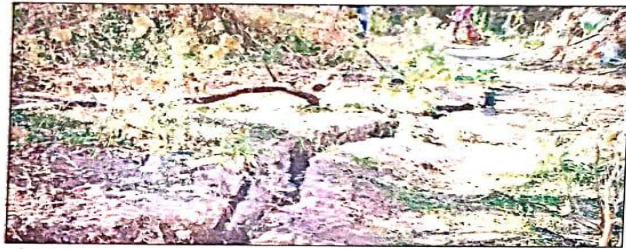
Some farm lands have also developed cracks in Joshimath

Some local residents said they had asked tenants to vacate houses. Some of the affected families have moved to safer locations in Joshimath and some have moved back to native villages. After intense protests by locals, the state government has ordered a survey on Joshimath. Studies have revealed that the town, which is gateway to Badrinath, Auli and Valley of Flowers, is built on an unstable foundation of "thick landslide cover" which can cave at the smallest disturbance. Numerous constructions, high footfall and ero-