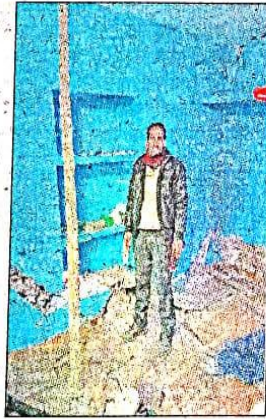
सुनील वार्ड में क्षतिग्रस्त मकान।