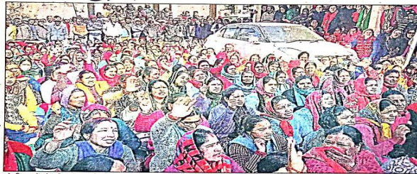
जोशीमठ में हो रहे भूधंसाव के खिलाफ प्रभावित लोगों ने शनिवार को तहसील में घटना दिया।