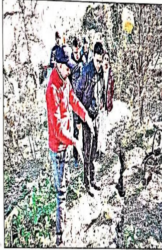
जोशीमठ में मंगलवार को भू कटाव का निरीक्षण करते जिलाधिकारी हिमांशु खुराना।

मंगलवार को जिलाधिकारी हिमांशु खुराना ने संबंधित विभागों के अधिकारियों के साथ जोशीमठ पहुंचकर कुछ क्षेत्रों का स्थलीय निरीक्षण किया। इस दौरान प्रभावित परिवारों ने जिलाधिकारी से उन्हें बचाने व अन्यत्र शिफ्ट करने की मांग की। जिलाधिकारी ने लोगों को आश्वस्त किया कि उन्होंने जोशीमठ पहुंचकर यहां हो रहे कटाव की स्थिति जान ली है व वे तुरंत अपनी रिपोर्ट सरकार को भेज देंगे। जिसके बाद जल्दी ही भू-वैज्ञानिकों की जांच संचालित की जाएगी। कहा कि प्रशासन