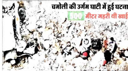
चमोली की उर्गम घाटी में हुई घटना मीटर गहरी थी खाई